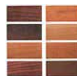
Legno e laminati