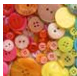
Borchie e bottoni