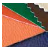
Pelli e pellicce