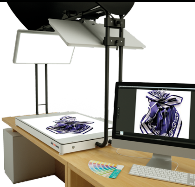
PHOTO MACHINE PER TESSUTI E ACCESSORI

SHOOTEX è una nuova macchina digitale assistita da software per fotografare in alta definizione tessuti ed una vasta gamma di materiali che vengono scontornati automaticamente in fase di scatto.