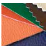
Pelli e pellicce