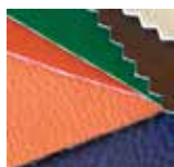
Pelli e pellicce