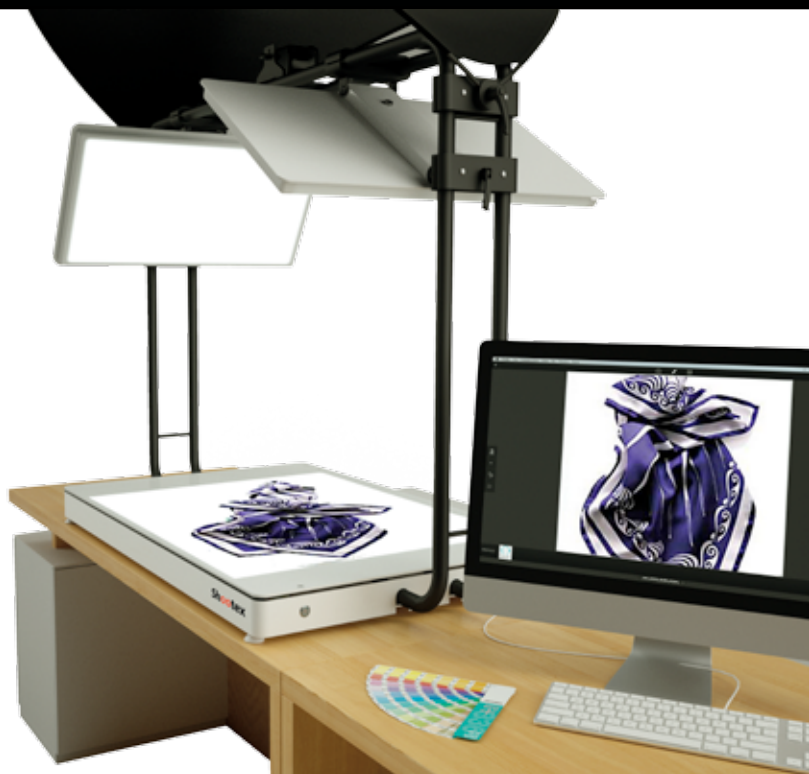
PHOTO MACHINE PER TESSUTI E ACCESSORI

SHOOTEX è una nuova macchina digitale assistita da software per fotografare in alta definizione tessuti ed una vasta gamma di materiali che vengono scontornati automaticamente in fase di scatto.